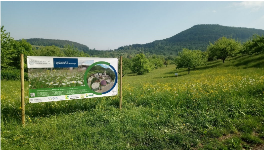
Fauna-Flora-Habitat Mähwiese (Eningen u.A., 2020)